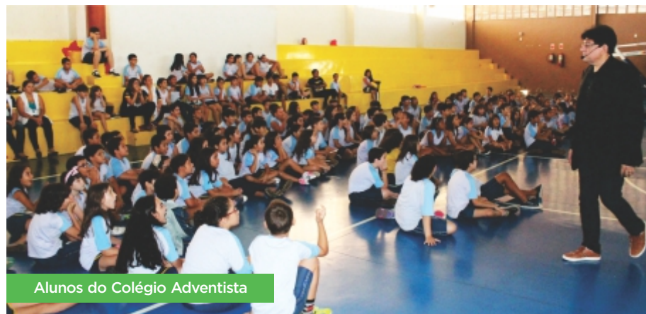
Alunos do Colégio Adventista