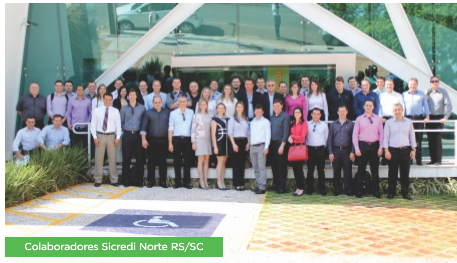
Colaboradores Sicredi Norte RS/SC

“Viemos conhecer um pouco da realidade e experiência de vocês”, disseram os visitantes. No entanto, eles trouxeram na bagagem muitos presentes preciosos, tais como: realizações e conhecimentos, os quais foram oferecidos com sorrisos e boa vontade explícitos.