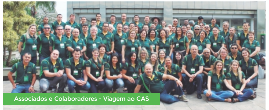
Associados e Colaboradores - Viagem ao CAS

Nesta edição o palestrante principal será o Ex-ministro da Agricultura e maior ícone brasileiro do Cooperativismo, Roberto Rodrigues, que discorrerá sobre os principais desafios do Cooperativismo nacional para os próximos anos.