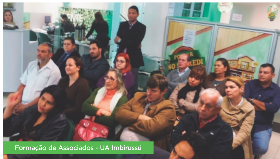
Formação de Associados - UA Imbirussú