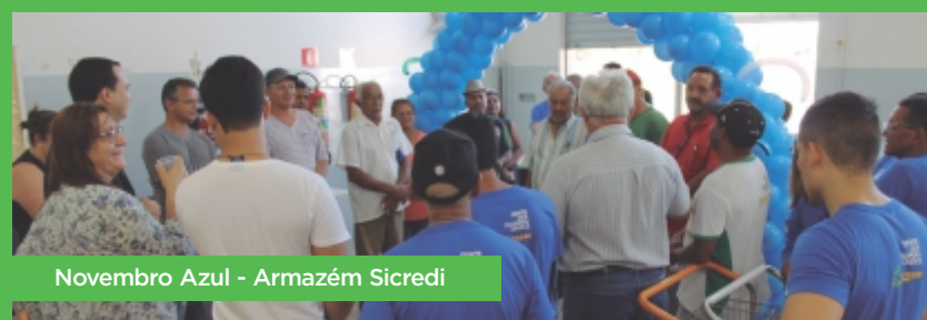
Novembro Azul - Armazém Sicredi

É uma alegria muito grande podermos constatar o quanto as pessoas estão aproveitando essas oportunidades para somar, acrescentar a si mesmas, formas e maneiras de observar, pensar e interagir com os desafios do dia a dia, tendo como diretriz a vontade de acertar, de fazer o que tem que ser feito, de um jeito mais proveitoso e racional. De forma especial às comunidades de Tocantins e Bahia.