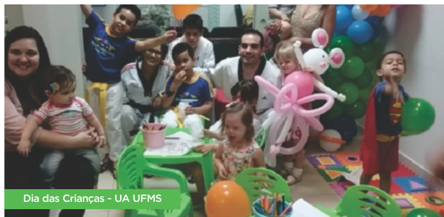
Dia das Crianças - UA UFMS

Este ano, por exemplo, realizou uma série de ações como: brincadeiras, pintura facial, distribuição de pipoca, algodão doce e outras guloseimas. E ainda esquetes com a participação, ao vivo, do seu personagem característico, o Poupedi, além da distribuição de seus bonecos.