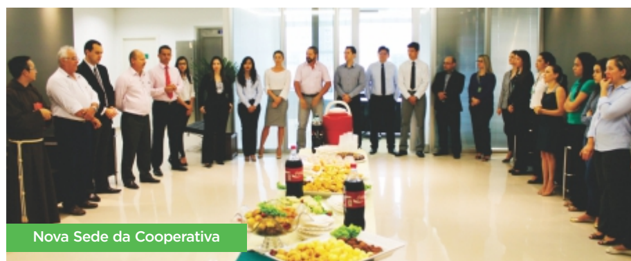
Nova Sede da Cooperativa