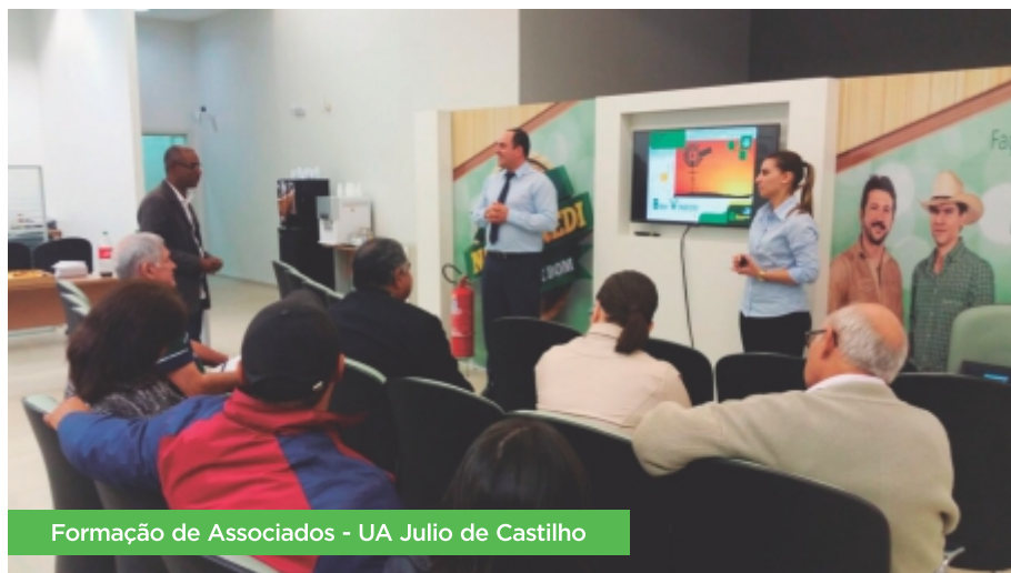
Formação de Associados - UA Julio de Castilho