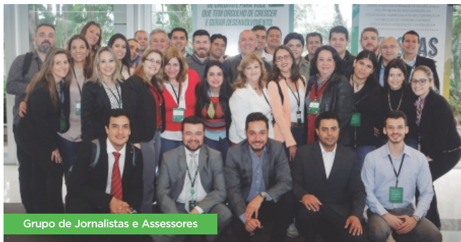
Grupo de Jornalistas e Assessores