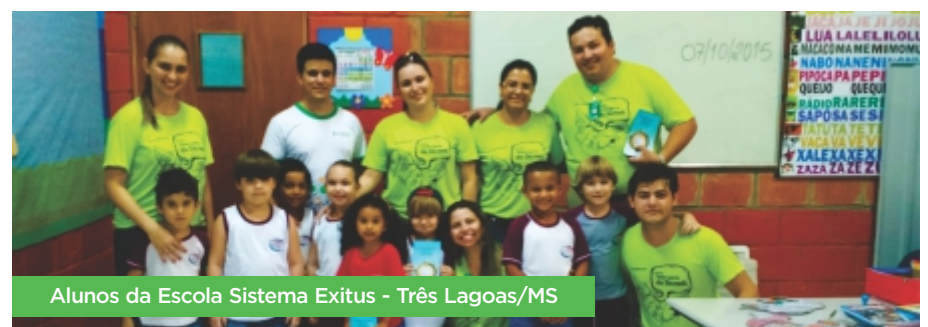
Alunos da Escola Sistema Exitus - Três Lagoas/MS

Na página www.pouparprachegarla.com.br , os associados e o público em geral encontram informações e o simulador, que aponta o quanto será necessário investir por mês. A cada nova simulação, o usuário saberá mais sobre os benefícios da poupança, esclarecendo as principais dúvidas sobre o produto e reforçando a economia para a realização de um sonho. Ao final de cada simulação, é possível compartilhar o sonho por meio de cards personalizados diretamente com os amigos pelo Facebook. Educação e lazer juntos em seu benefício.