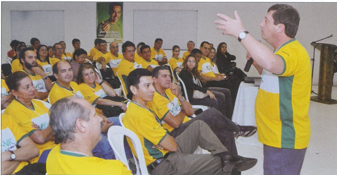
OS NOVOS COORDENADORES PLANEJAM AS AÇÕES QUE AFETARÃO TODOS OS ASSOCIADOS NO SENIC EM TRÊS LAGOAS

No momento estão sendo executados três projetos do plano de ação: Mãos Amigas, Campanha do