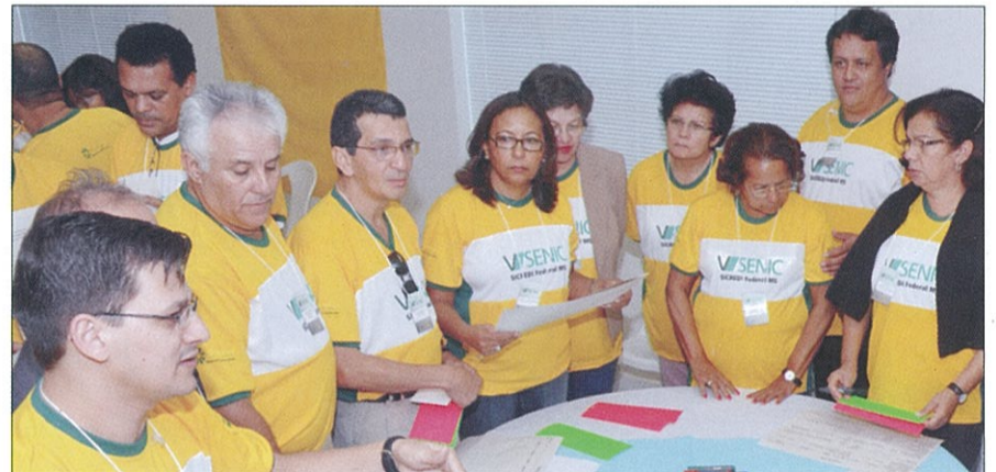
TAREFA DESENVOLVIDA COM OS COORDENADORES PARA AMPLIAR A COMPREENSÃO SOBRE O PLANEJAMENTO