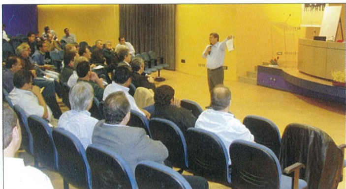
OS PRINCIPAIS EXECUTIVOS DO SISTEMA REAFIRMARAM A IMPORTÂNCIA DO APRIMORAMENTO DO MODELO DE GOVERNANÇA