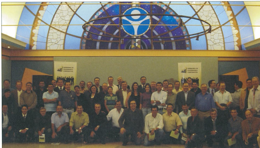
DIRIGENTES E EXECUTIVOS DE TODAS AS COOPERATIVAS DA CENTRAL BRASIL CENTRAL PARTICIPARAM DO EVENTO

propriedade sobre a gestão. "Assim, é possível garantir um desenvolvimento econômico sustentável, proporcionando melhorias no desempenho da instituição", afirmou o representante do BACEN.