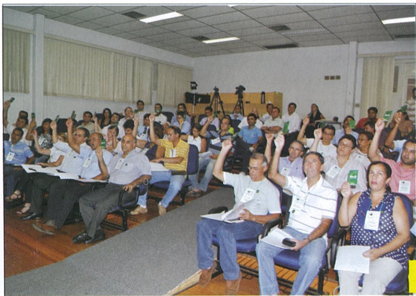
SISTEMA INOVADOR DE DELIBERAÇÃO AGRADA A TODOS

Na AGO ocorreu ainda a prestação de contas, a eleição dos componentes dos Conselhos de Administração e Fiscal, o plano de utilização do FATES, fixação de verbas de representação da diretoria executiva e cédula de presença para os membros dos Conselhos de Administração e Fiscal e a ratificação das novas propostas de regimento interno do SICREDI-RIS e do regimento eleitoral do SICREDI.