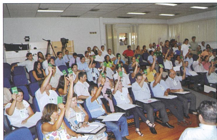
O VOTO DE CADA DELEGADO SIMBOLIZA A VONTADE DOS ASSOCIADOS DE SEU NÚCLEO