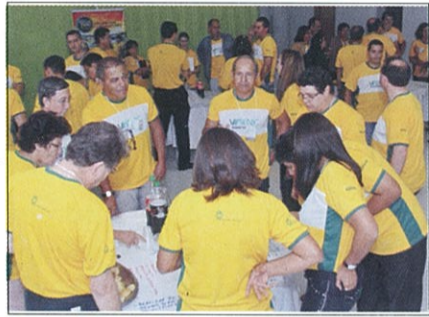
OS LÍDERES NAS DINÂMICAS DE GRUPO

O VII Seminário de Nivelamento de Informações dos Núcleos Cooperativos – o SENIC foi realizado em Três Lagoas, no mês de maio. A delegação de líderes, com cerca de 80 pessoas, vinda de