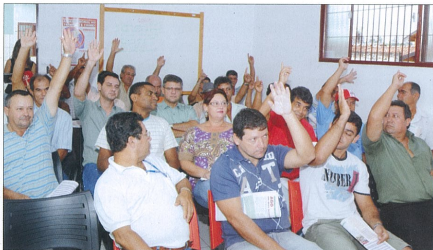
TODOS OS ASSUNTOS DA ASEMBLÉIA GERAL FORAM DELIBERADOS PELOS NÚCLEOS (NÚCLEO DO MORENÃO)

Haverá também a participação efetiva nos projetos oriundos do Sistema SICREDI, quais sejam: Campanhas, Programas Crescer, Pertencer e Cooperjovem.