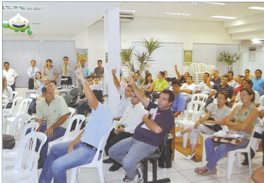
ASSOCIADOS DEFINEM O VOTO DO DELEGADO NA AGO (NÚCLEOS DA UA CENTRO)

O Plano de Ação dos Núcleos Cooperativos é composto por diversos projetos. Esta importante peça de administração moderna foi elaborada durante um Seminário específico para esta tarefa, ano passado, no qual participaram todos os Líderes diretamente envolvidos com os núcleos.