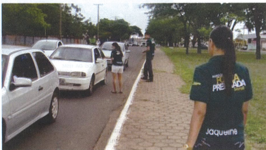
BLITZ REALIZADA EM CAMPO GRANDE EM OUTUBRO