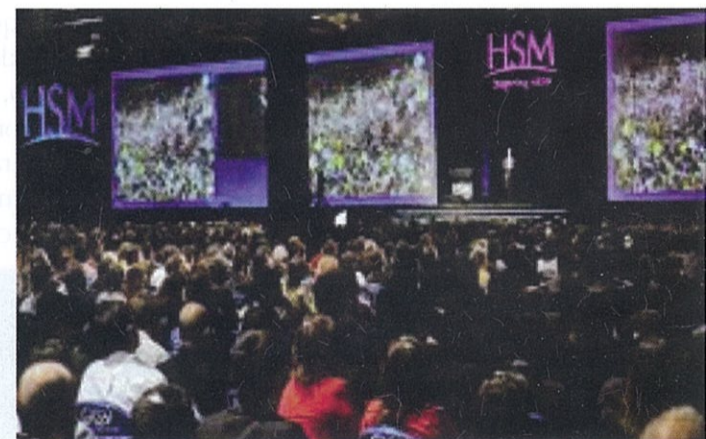
AS EMPRESAS MAIS RELEVANTES, COMO O SICREDI, PARTICIPAM DOS EVENTOS DA HSM