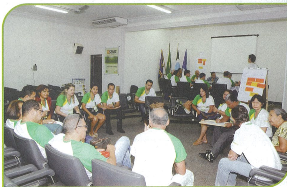
TRABALHOS EM GRUPO

O resultado produzido – a “colheita” – consistiu de diversos temas diferentes que expressavam o ponto de vista e preocupação dos participantes, com os respectivos encaminhamentos, alguns de aplicação imediata, outros sujeitos a estudos de viabilidade por parte dos gestores da Cooperativa, incluindo a adequação às normas e procedimentos internos do sistema.