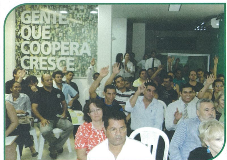
REUNIÃO DO NÚCLEO SINGULAR

Você, associado, pode e deve apoiar as ações Núcleo ao qual está vinculado. Procure os seus gerentes. Lembre-se: você também é o responsável pela qualidade e desenvolvimento da Cooperativa. Sua participação é essencial para que ela continue crescendo com sustentabilidade.