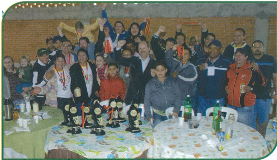
PREMIAÇÃO DA SICREDI UNIAO MS NO ULTIMO TICOOP

A cada dois anos ele ocorre para a alegria de muitos. Ele é democrático e de fácil acesso. Já está inserido no calendário fixo de eventos do Estado de MS. Mobiliza um número crescente de participantes, por isso tornou-se bienal, antes era anual. Estamos falando do Ticoop – o Torneio de Integração Cooperativa, uma realização típica do Estado de MS.