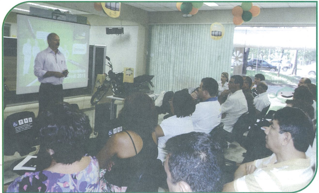
REUNIÃO DO NÚCLEO CENTRAL

São formados pela reunião de associados de uma determinada área geográfica, de um ou mais setores ou unidades administrativas dos órgãos públicos ou empresas, ou ainda pela afinidade