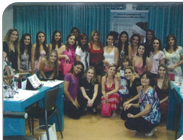
PARTICIPANTES FICARAM FELIZES COM O RESULTADO