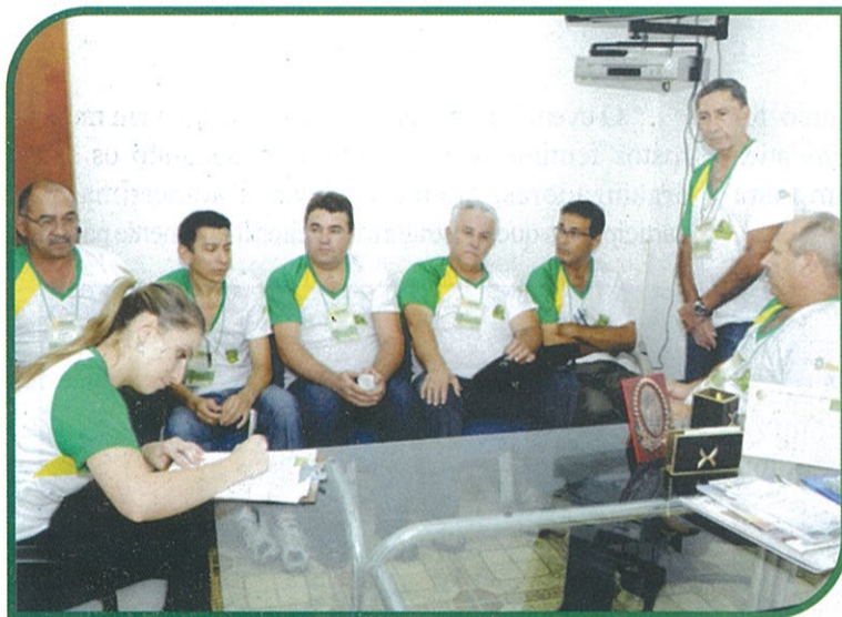
NOVOS MEMBROS DO NÚCLEO CENTRAL

Os objetivos do Núcleo Cooperativo Central podem ser resumidos numa frase: coordenar a educação continuada no âmbito interno prioritariamente e externo também nas localidades em que a Cooperativa atua. Isso é feito através da promoção das atividades dos Núcleos singulares.