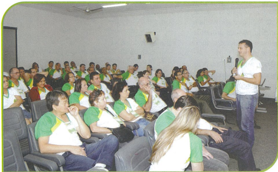
SEMINÁRIO DE NIVELAMENTO ONDE OS LÍDERES TRABALHARAM INTENSAMENTE PARA O APERFEIÇOAMENTO DO NÚCLEO

Novo modelo de participação "open space" movimenta os líderes da Cooperativa em Corumbá