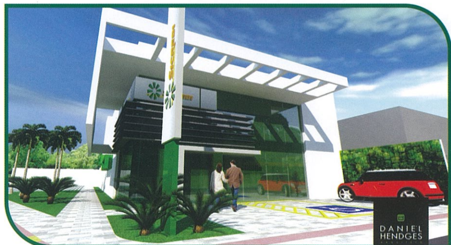
NOVAS INSTALAÇÕES DA UA JULIO DE CASTILHO

No entanto, independente do tipo de atendimento que o associado preferir, para se relacionar com a sua Cooperativa, ele sabe que o calor humano está presente e faz toda a diferença. Porque ele é a razão de existir da sua empresa. Que a sua voz e opinião são sempre ouvidas e levadas em consideração. Afinal, ele é o dono do negócio.