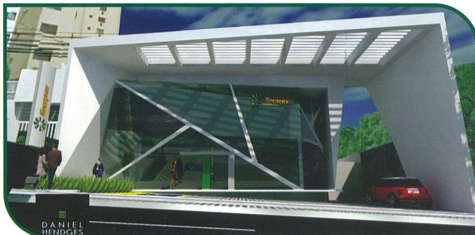
INSTALAÇÕES DA NOVA UA AFONSO PENA