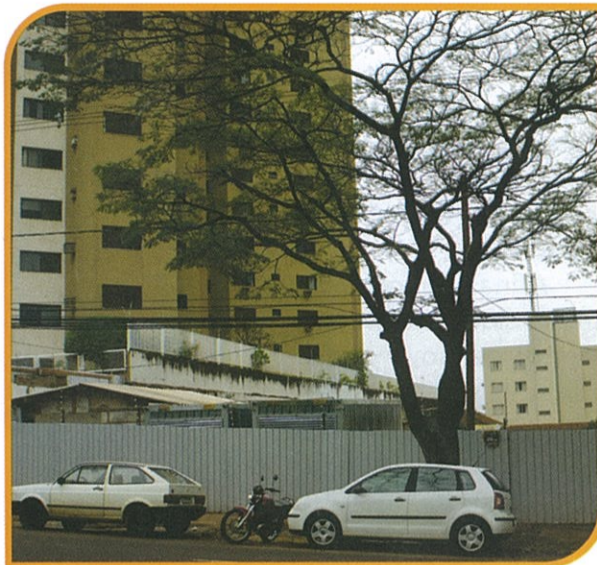
CANTEIRO DE OBRAS DA UAFONSO PENA

tecnologias de atendimento, de interação e qualidade dos produtos e serviços adotados recentemente pela Sicredi União MS.