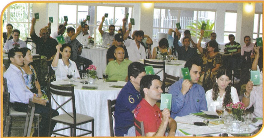
UMA CELEBRAÇÃO DA DEMOCRACIA - REPRESENTANTES DE APROXIMADAMENTE 18 MIL ASSOCIADOS NA AGO

Do ponto de vista institucional, os resultados foram ainda mais animadores. Confira agora alguns deles e avalie você também: eleição dos novos membros do Conselho de Administração, com ênfase na renovação e à presença feminina; eleição e renovação de 71% dos líderes que coordenarão os núcleos; participação recorde de mais de 10% do quadro de associados, sem qualquer incentivo extra, dentre outros itens importantes para o desenvolvimento cada vez maior da Cooperativa e do Sistema.