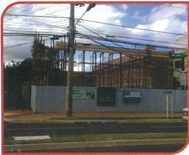
CANTEIRO DE OBRAS DA UAJULIO DE CASTILHO

Mais do que prédios novos, os novos espaços de convivência para a realização de negócios da Cooperativa exalam inovação, no sentido mais amplo do termo, porque incorporarão imediatamente as novas