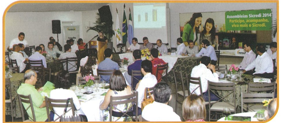
COORDENADORES EM ASSEMBLEIA ORDINÁRIA PARTICIPAÇÃO RECORDE DOS ASSOCIADOS NAS AN

Uma grande reunião de líderes. Uma celebração à democracia. Uma experiência de profissionalismo. As três frases acima caracterizam e definem com precisão o que foi participar da Assembleia Geral Ordinária no dia 26 de abril e das Assembleias dos 39 Núcleos, aos quais estão agrupados os mais de 18 mil associados da Sicredi União MS, nos meses de março e abril passado.