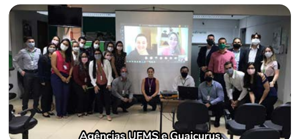
Agências UFMS e Guaicurus