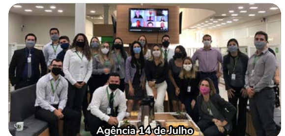
Agência 14 de Julho

Até o momento, as agências Luís Eduardo Magalhães, Barreiras, Sede, UFMS, Guaicurus, Afonso Pena, Plataforma Sicredi e 14 de Julho, já passaram por este treinamento, e em breve será programado nas demais agências.