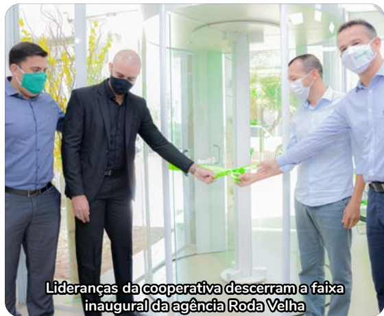
Lideranças da cooperativa descerram a faixa inaugural da agência Roda Velha