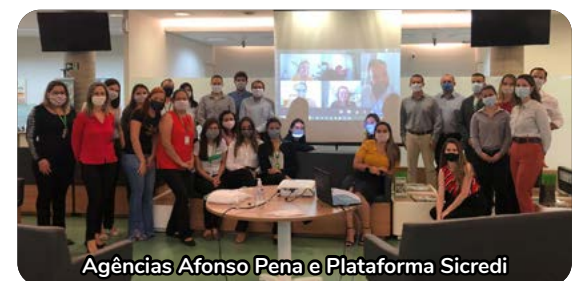
Agências Afonso Pena e Plataforma Sicredi