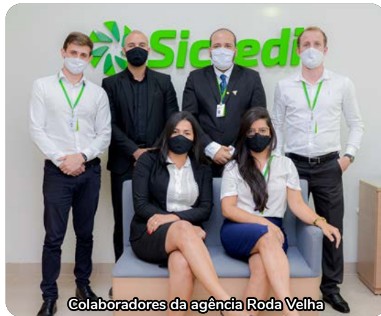
Colaboradores da agência Roda Velha