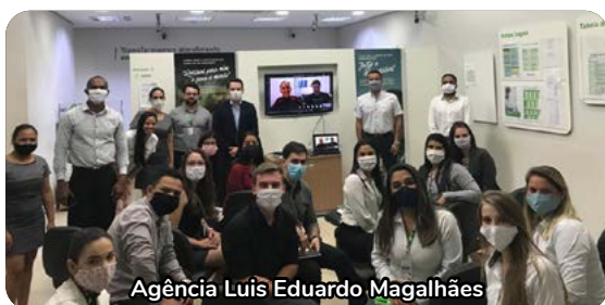
Agência Luís Eduardo Magalhães