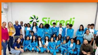
Comemoração do Dia dos Professores (PUFV)

encerrado com uma atividade integradora que culminou em uma Mesa Redonda, contando com a participação de alguns representantes das instituições visitadas na sede da Regional da Cooperativa na Bahia, em LEM. Ações como esta, fomentam a reflexão sobre a importância de unirmos esforços que reverberam benefícios comuns e fortalecem iniciativas democráticas e humanitárias.