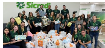
Colaboradores arrecadaram brinquedos para doação