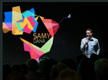
Samy Dana palestrando no evento de lançamento do escritório

Esperado por todos, para celebrar o momento, a Cooperativa trouxe o economista Samy Dana, que falou sobre o cenário atual da economia. O palestrante ainda disse que o sistema cooperativista é um sistema de sucesso, pois oportuniza melhores condições e taxas para a população. O escritório abriu as portas ao público no dia 28/outubro e fica localizado na Avenida Afonso Pena 4324, em Campo Grande-MS.