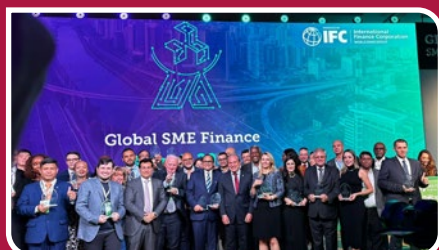
Celebração de premiação do Global SME Finance