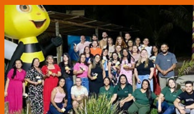
Reunião em Roda Velha/BA