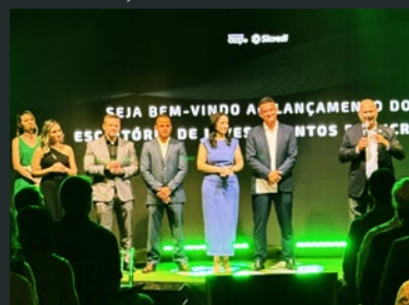
Cerimônia de lançamento do Escritório de Investimentos