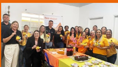
Reunião em Água Clara/MS