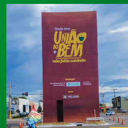
O lançamento do selo União do Bem é com a revitalização do Cristo em Três Lagoas