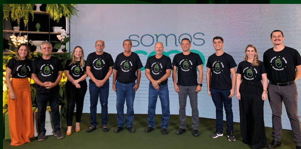
Em 2022, de forma inédita ocorreu uma assembleia de núcleo única em formato digital e ao vivo