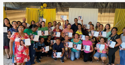
Cerca de 150 professores receberam a sensibilização do PUFV