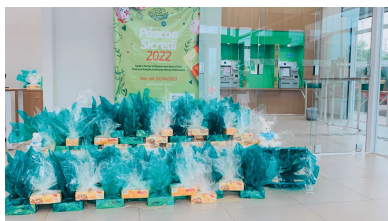
A Cooperativa arrecadou ovos de Páscoa e caixas de bombom

As doações foram entregues em projetos sociais, instituições carentes e