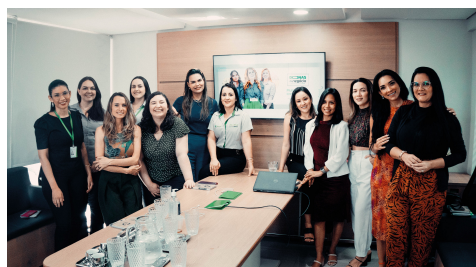
Embaixadoras do programa Donas do Negócios são apresentadas em evento

O lançamento do programa está previsto para junho com os pilares econômicos e não econômicos alinhados e prontos para serem executados.