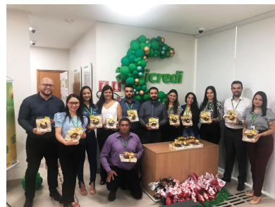
Colaboradores se mobilizaram pela campanha

bairros em todas as comunidades que a Cooperativa atua nos estados de Mato Grosso do Sul, Tocantins e Oeste da Bahia.