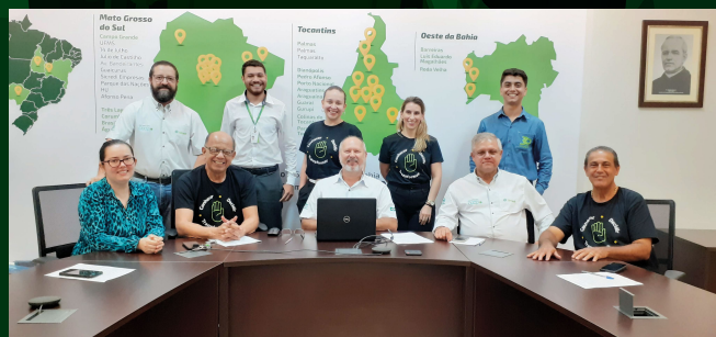
A iniciativa reforça o vínculo e a proximidade da Cooperativa com o associado