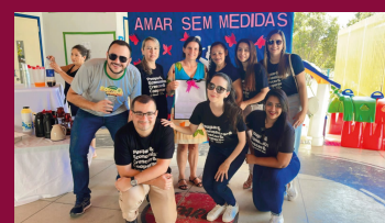
Membras do Comitê Mulher são homenageadas