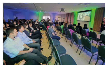
Palestra aos colaboradores foi um momento inspirador