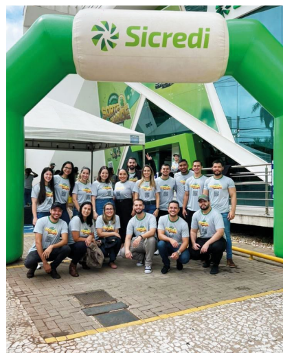
Colaboradores realizaram mutirões em diversas cidades