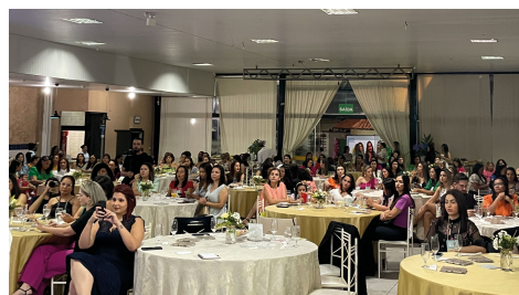
Cerca de 200 mulheres participaram do evento