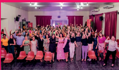
Mais de 460 mulheres participaram dos lançamentos