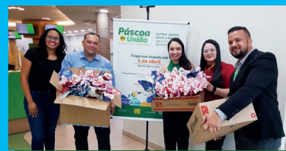
Mais de 8 mil itens de chocolates foram arrecadados