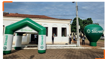
Natividade (TO) conta com um Escritório de Negócios