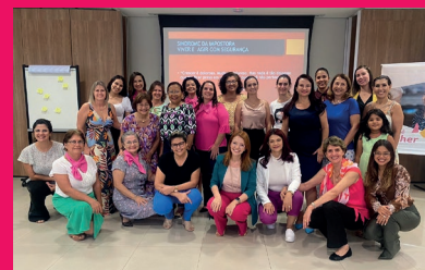
Membras se reúnem e iniciam as atividades de 2023

Em abril também ocorreu a formação para as madrinhas dos comitês e para o próximo semestre está previsto a constituição do Comitê Mulher da Regional Centro Sul do Tocantins, curso de formação para todas as mulheres dos quatro comitês.