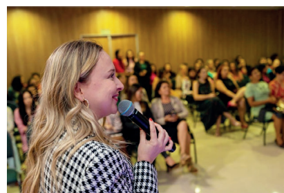
Colaboradora irá representar os jovens brasileiros no Woccu

no potencial transformador do jovem no cooperativismo, e estamos entusiasmados, para que pessoas do mundo todo saibam também do programa Donas do Negócio", afirma o presidente da Sicredi União MS/TO e Oeste da Bahia, Celso Régis.