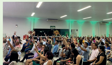
Mais de 7300 associados participaram das assembleias, tanto presencialmente, como de forma on-line