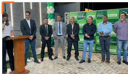
Lideranças da Cooperativa e da comunidade prestigiaram a inauguração em Tocantinópolis (TO)