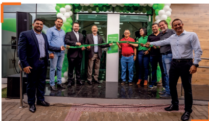
Taguatinga (TO) ganhou sua 1ª agência do Sicredi