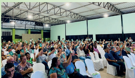
Ao todo foram 31 encontros e os associados decidiram os rumos da Cooperativa

E no dia 26 de abril, ocorreu a Assembleia Geral Ordinária (AGO) dos Delegados, que foi no formato on-line e apresentou todos os votos dos Núcleos.