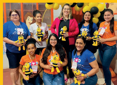
Professores foram capacitados para aplicarem o programa nas escolas

Essa iniciativa acredita em um futuro com cidadãos mais justos, solidários e empreendedores, que respeitem a diversidade e dialoguem para tomar decisões.