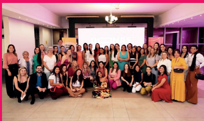
Mais cinco agências podem contar com o programa Donas do Negócio