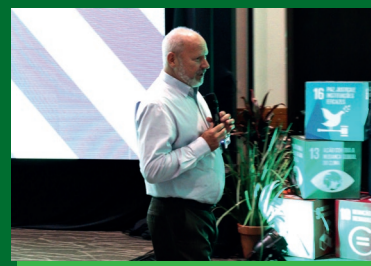
Lançamento reuniu lideranças da Cooperativa

mento com as lideranças foi realizada uma live com todos os colaboradores para apresentação do Planejamento Estratégico, dando início a uma jornada de aprendizagem para comunicar e engajar, oportunizando momentos de informação, andamento das ações e detalhes das estratégias.