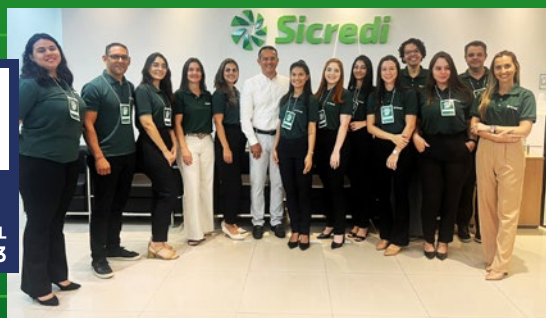
A Cooperativa promove diversos programas para desenvolver seus colaboradores, como o Programa Trainee