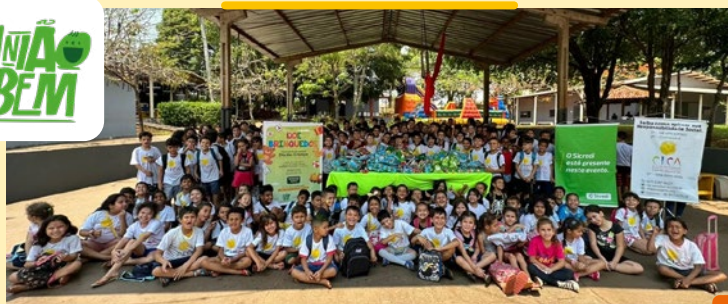
A Cooperativa realizou a campanha, que arrecadou cerca de 3700 brinquedos.