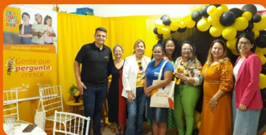
Formação na Escola Municipal CEI – Olga Salim Dualibi, em Água Clara/MS.

Em novembro, a série ocorreu nas escolas Coopeb, em Barreiras/BA, com o Colégio Maria Edith Rodhen, Roda Velha/BA, com a Coopefa em Formoso do Araguaia/TO, com a Escola Municipal Firmina Pereira dos Santos Pinto e Escola Municipal Maria Angélica Martins de Souza, Ipueiras/TO e com a Escola Municipal Ottomar Schwengber em Luís Eduardo Magalhães/BA.