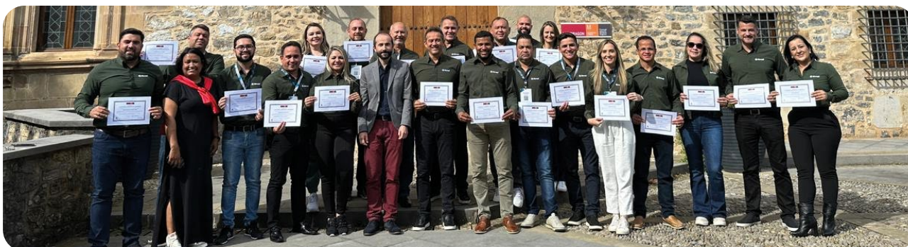
A visita técnica durou três dias e o grupo conheceu o Case Mondragón