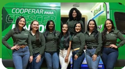
A Cooperativa participou de vários eventos do agronegócio para reforçar o relacionamento com os associados

Esses eventos são importantes para a população, pois envolve as pessoas em cavalgadas, shows, atrações culturais e também geram negócios.