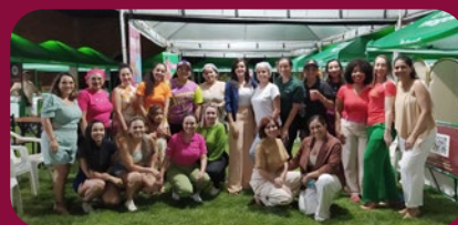
Expositoras na feira de Taquaralto/TO

Foram mais de 5 mil pessoas participantes e gerou mais de 200 mil reais em negócios, como parte de nosso compromisso de fomento a economia local.