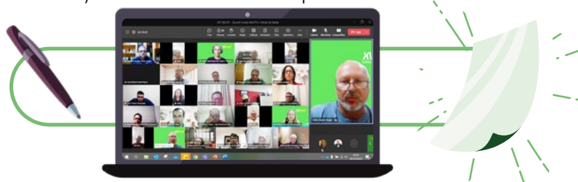
O evento aconteceu no formato on-line e teve a participação de 33 associados

Para haver esse trabalho com eficiência é preciso uma formação adequada e por isso a Sicredi União MS/TO e Oeste da Bahia realiza capacitações frequentes.