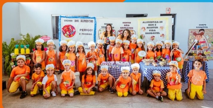
As culminâncias acontecem no pátio das escolas parcerias no mesmo modelo de uma Mostra Cultural