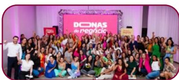
Lançamento em Luis Eduardo Magalhães/BA