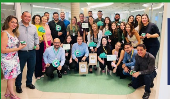
A pesquisa contou com a participação de 34 mil colaboradores do Sicredi

O programa terá treinamentos técnicos e comportamentais, possibilitando aprendizado em todos os segmentos da instituição financeira cooperativa. Ao longo do período, o Trainee ganha experiência fomentando relacionamento com os associados e entregando as melhores soluções financeiras. A jornada possibilita ainda aprendizados em todos os segmentos existentes na cooperativa, nas quais desenvolverá conhecimentos diversos, realizando treinamentos e vivenciando a rotina das carteiras Pessoa Física, Pessoa Jurídica e Agronegócios.