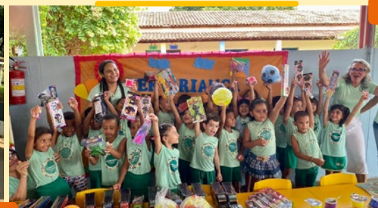
Todas as doações foram distribuídas em 43 entidades.